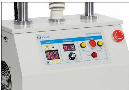
Tableau de commande haute gamme - affichage de vitesse numérique - fonction répétition numérique